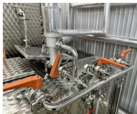
多彩なオプション: 分割受槽、分岐配管、アルコールメーター、ウロコバフ仕上げ